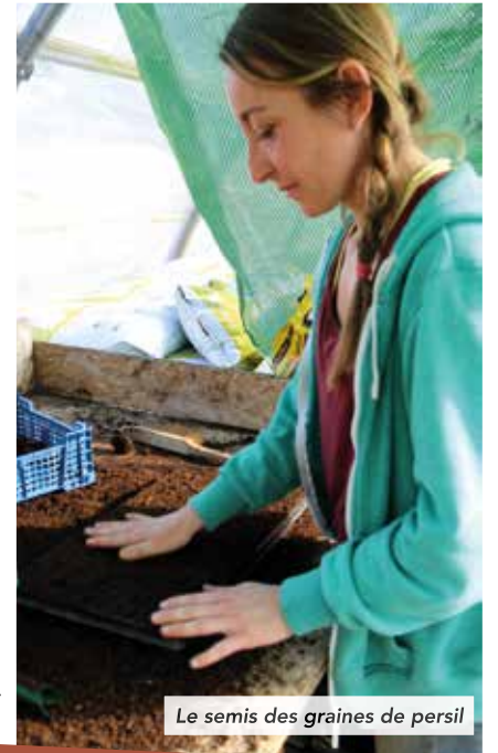
Le semis des graines de persil