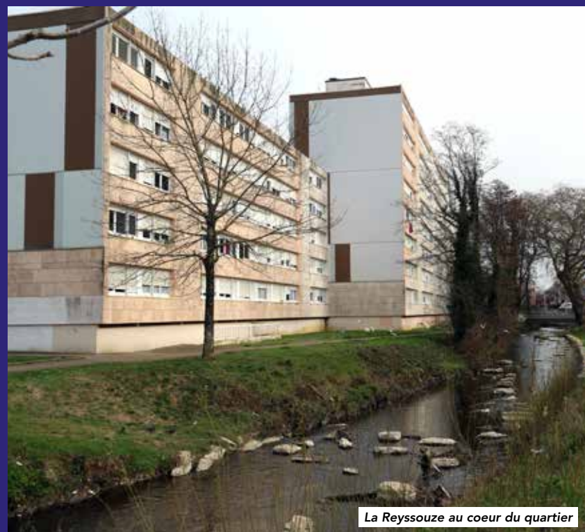
La Reyssouze au cœur du quartier

Bourg Habitat : 22,6 M€, Ville de Bourg : 9,8 M€, Agence Nationale de Rénovation Urbaine (ANRU) : 10 M€, l'Agglomération CA3B : 6,3 M€, la Région Auvergne-Rhône-Alpes : 3 M€, le Conseil Départemental de l'Ain : 2,5 M€, et 137 000 € par la Banque des Territoires Caisse des Dépôts pour le financement des études. Le complément proviendra de recettes annexes.